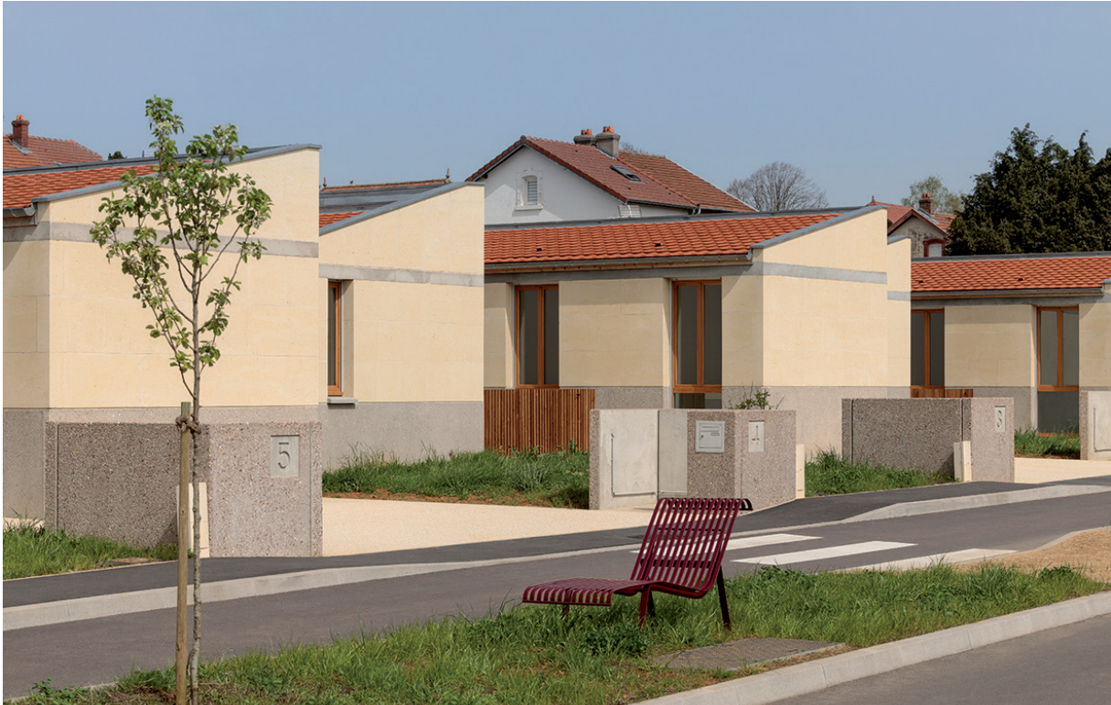
Le programme de 16 logements pour seniors à Mont-Bonvillers (Meurthe-et-Moselle), pour Vivest et la Communauté de communes Cœur du Pays Haut. ©Arnaud&Delrue.

Vous adhérez à des réseaux comme le Mouvement pour une Frugalité heureuse et créative**. Qu'est-ce qui motive cet engagement ?