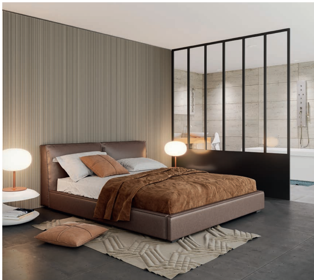
Le concept Satellite d'Installux à laquer dans toute la gamme RAL, a été optimisé. Il comprend huit profils et 14 accessoires pour la réalisation de verrières avec ou sans portes battantes.