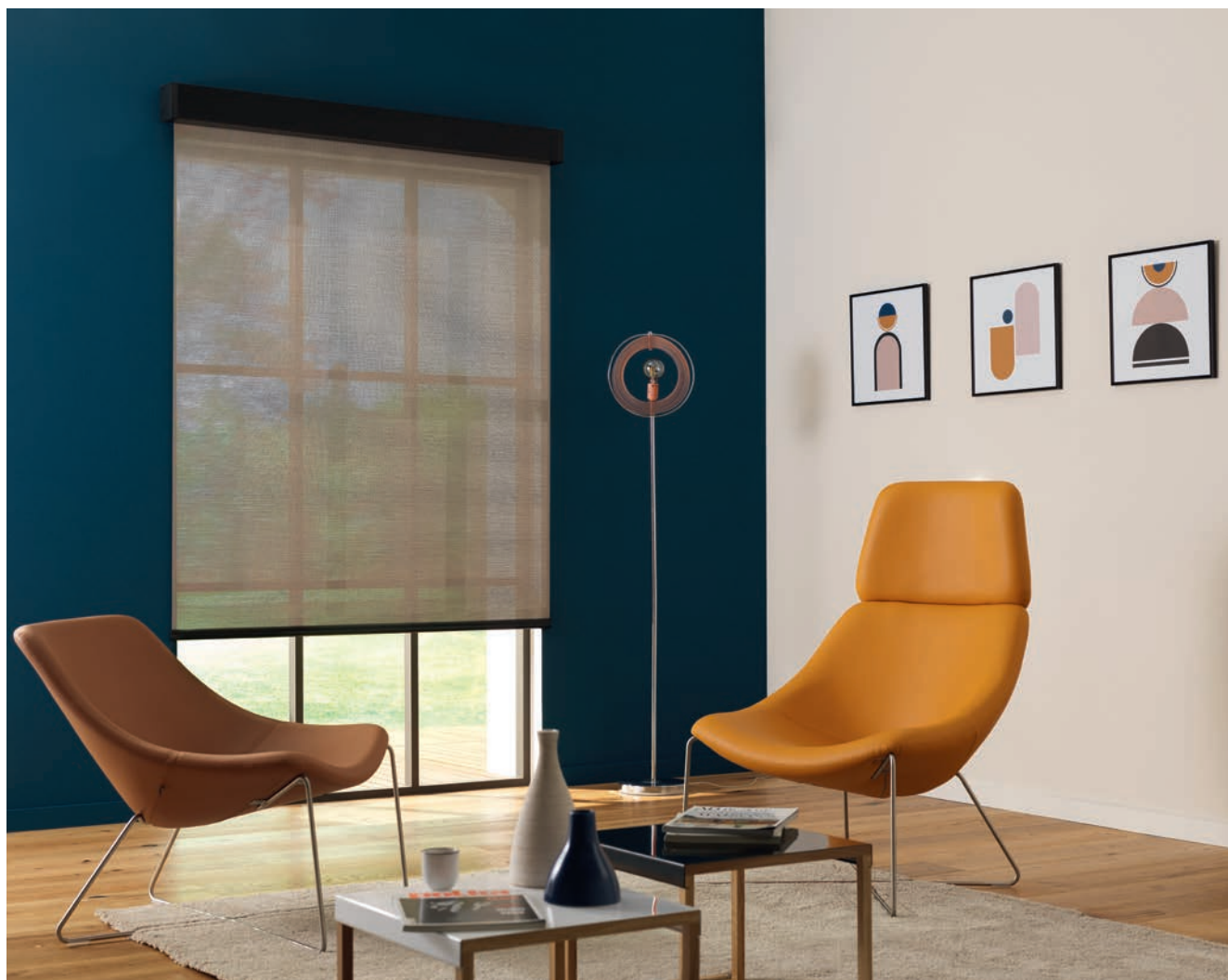
Premier screen tissé de la gamme Soltis Serge Ferrari, Soltis Touch est disponible en deux laizes 180 cm et 270 cm avec trois coefficients d'ouverture : 1%, 3 % et 5 %.

Serge Ferrari fait appel aux sens avec sa gamme Soltis Touch dédiée à l'aménagement des espaces intérieurs. Dans son tissage, une fibre textile brute est intégrée pour un rendu matière raffiné et différenciant. Adaptée aux stores enrouleurs, aux stores à bandes verticales ou aux panneaux japonais, la toile se décline dans des tonalités naturelles. Elle rime aussi avec gestion de l'éblouissement, transparence et vue sur l'extérieur, absorption acoustique, excellente résistance au froissage et à la déchirure, classement au feu (M1, B-S2, d0). Mais aussi confort thermique avec une réduction des apports solaires pour le maintien d'une température intérieure stable, même en été, sans sollicitation accrue des équipements de climatisation.