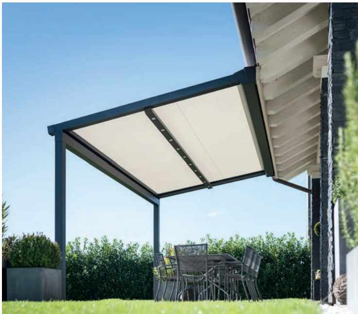
Antibactérien, anti-moisissures, le tissu sans PVC Irisun Blockout de Giovanaradi au pouvoir occultant équipe les protections solaires toiles de KE.