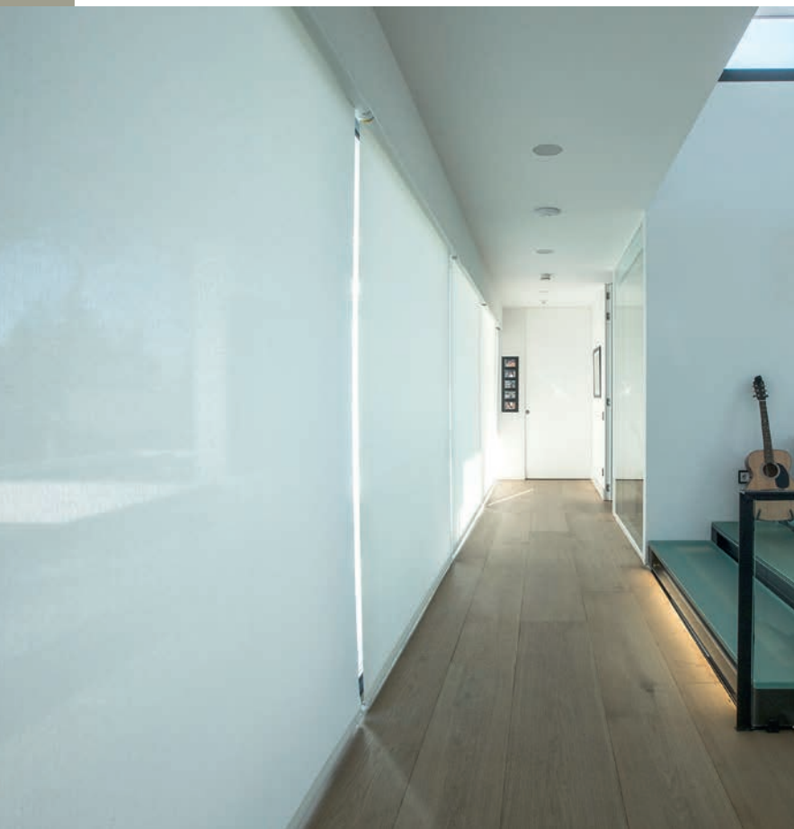
La gamme de tissus Éco de Bandalux, certifiée Cradle to cradle bénéficie du classement Euroclasse Bs2d0. Elle est inodore, sans halogènes et ne dégage aucun COV.