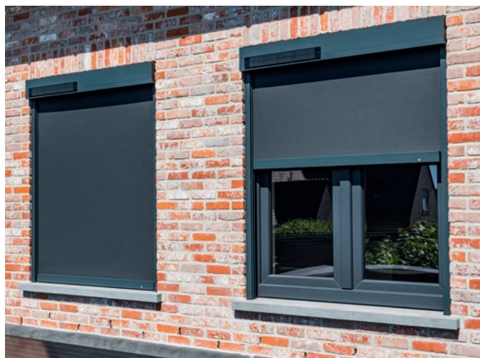
Dédié à la rénovation, le Fixscreen Solar de Renson posé devant le châssis fonctionne à l'énergie solaire.

Le store Topfix pour vitrage incliné et horizontal est équipé de la technologie Fixscreen de Renson qui assure une tension de la toile même en cas de vent jusqu'à 120 km/h. Les dimensions compactes du caisson assurent une intégration parfaite dans l'architecture. Le Topfix Max permet d'équiper des surfaces encore plus grandes, jusqu'à 30 m 2 . Une technique de tension intégrée permet une tension parfaite de la toile en toutes circonstances, même en cas de construction ouverte. La gamme Topfix a été complétée avec le Topfix VMS, une solution brevetée, également équipée de la technologie Fixscreen et Smooth, spécialement conçue pour les verrières modulaires Velux Modular Skylights. Elle s'adapte aussi bien sur des modules fixes que mobiles et peut supporter des vents jusqu'à 120 km/h.