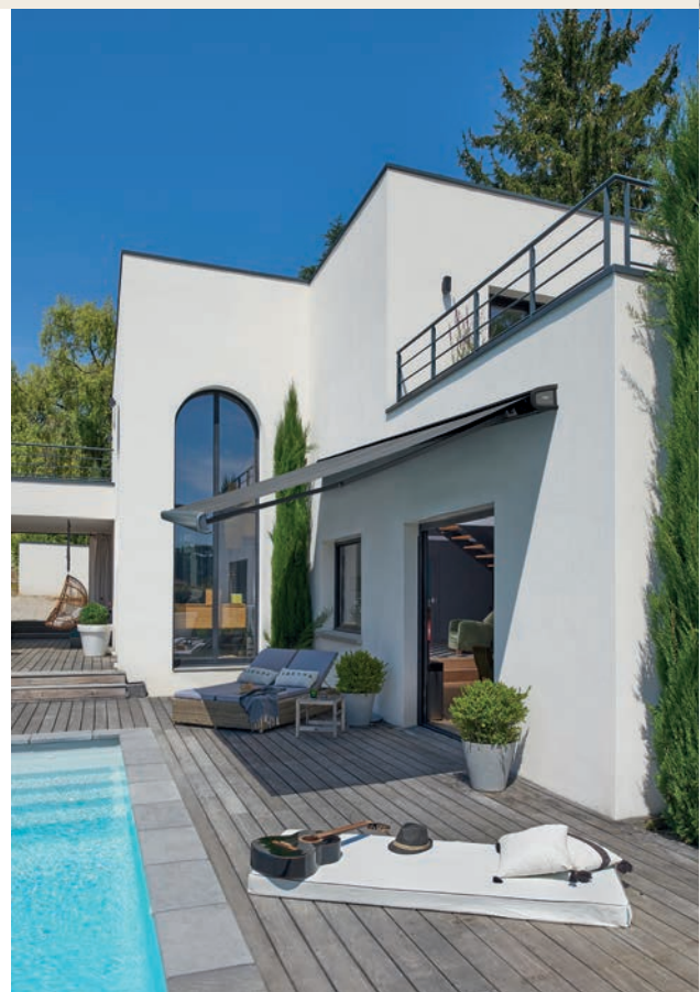
Leurs performances en termes de solidité et de résistance font d'Allure et Fétuna de Franciaflex des stores fiables et durables aux capacités dimensionnelles pouvant atteindre 11 mètres.

Les stores Allure et Fétuna de Franciaflex servent autant le confort des utilisateurs que l'esthétisme de la maison. À leur design unique est associée une fabrication robuste où chaque détail a été considéré pour intégrer les contraintes les plus drastiques en matière de résistance au vent, de performances thermiques et d'ergonomie. En pose murale ou au plafond, complété par un lambrequin