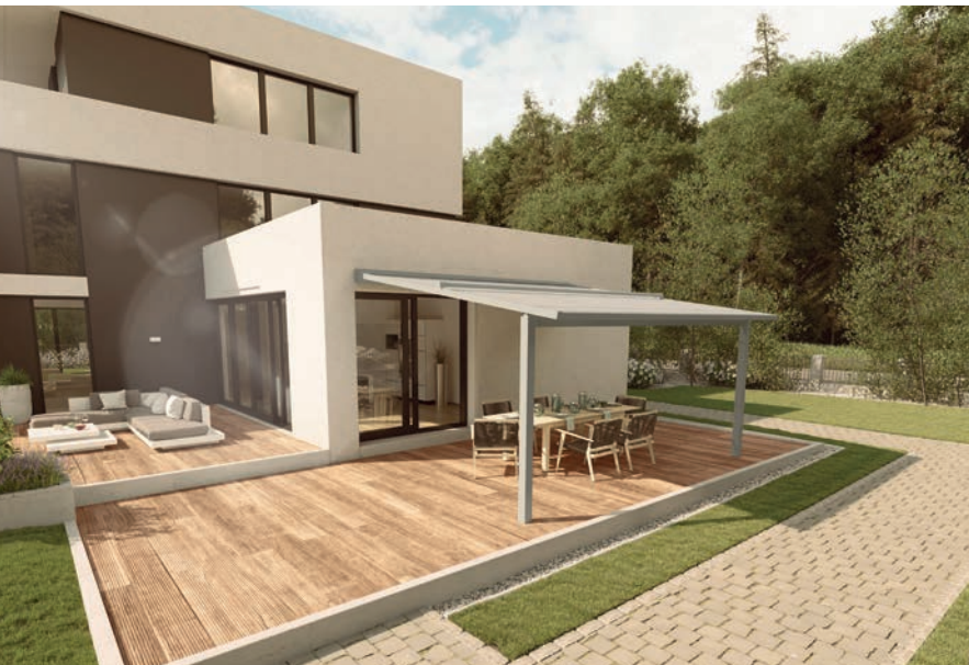
Ce store de pergola Perea 60 de Warema optimise le confort des terrasses avec ses barres à LED intégrés aux rails de guidage ou son radiateur chauffant. Le tout à piloter facilement grâce au système Warema Mobile.

Les stores Perea P60 pour pergola de Warema permettent d'assurer un ombrage moderne capable de résister même aux vents forts et aux averses de pluie. L'enroulement étanche à la pluie et perméable à la lumière possède une trame intégrée en PVC qui évacue l'eau vers le canal de drainage intégré. Le système breveté secudrive assure une excellente tension de la toile grâce à son guidage par bandes en acier sur toute sa longueur. Il supprime les interstices latéraux et assure un montage particulièrement rapide et simple. La toile se remonte entièrement dans le caisson. Filiforme, ce modèle couvre des terrasses jusqu'à 30 m 2 . Complété de stores à guidage Zip sur les parties verticales, les performances de la protection solaire sont accrues.