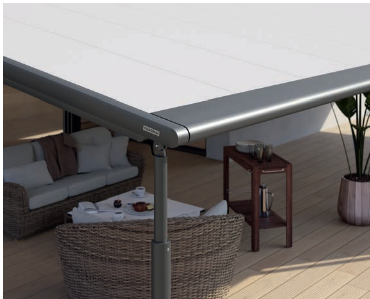
Reposant sur deux colonnes frontales, Markilux Pergola et Pergola Compact peuvent être abaissés d'une simple pression sur un bouton pour un écoulement confortable de la pluie.

Les modèles Markilux Pergola et Pergola Compact de Markilux sont des systèmes de stores guidés sur rail qui reposent sur deux colonnes frontales. Pouvant ombrager des surfaces de différentes tailles et être combinés individuellement avec d'autres modèles du fabricant, ils conviennent comme protection solaire. Afin de rendre l'utilisation des stores encore plus conviviale sur le plan technique, l'une des colonnes avant est désormais réglable électriquement en hauteur. Afin que l'eau de pluie puisse s'écouler trois hauteurs de réglage selon la taille du store sont disponibles : 20, 30 et 40 centimètres. Jusqu'à présent, l'abaissement se faisait à l'aide d'une manivelle. La commande électrique est combinée à un capteur de pluie. Le store peut être commandé et la colonne abaissée automatiquement pendant un court laps de temps.