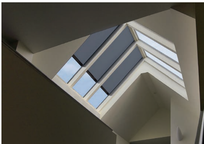
Dotée de la technologie Fixscreen de Renson pour résister aux vents extrêmes, la gamme Topfix protège du soleil les fenêtres de toiture.