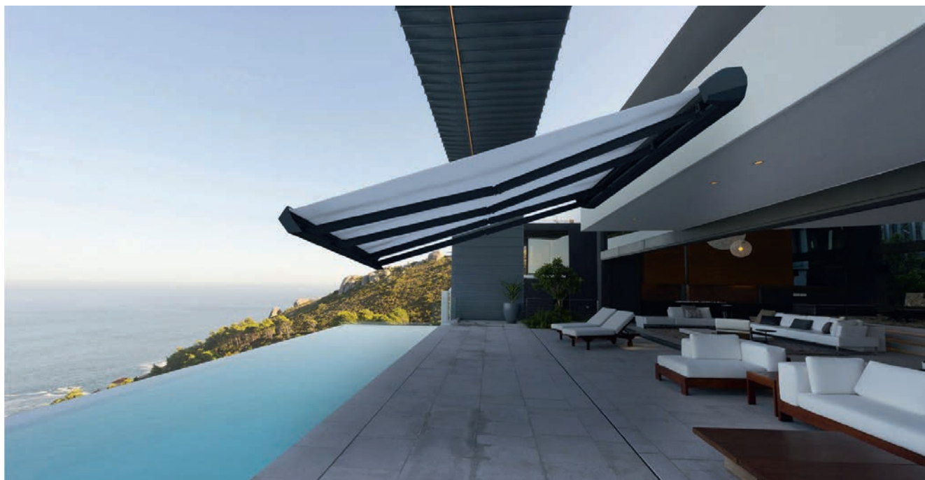
Le store coffre Diamant de Marquises associe un condensé d'avancées technologiques à un design contemporain.

Dernier né des stores coffres de Marquises , Diamant se démarque par son coffre biseauté et ses ogives à facettes saillantes. Il marie grande envergure, éclairage omniprésent, système de bras nouvelle génération et coloris qui reflètent les tendances. Par ailleurs, Marquises a investi dans une nouvelle machine qui permet de coller les toiles bord à bord. Il n'y