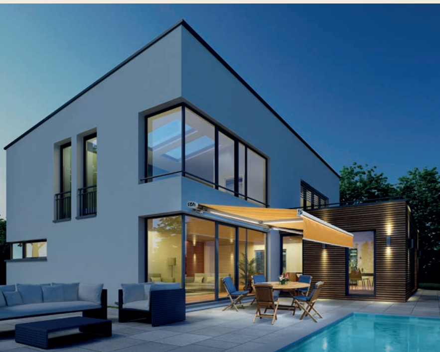
La nouvelle bannette Artémis de Soliso Europe, robuste et esthétique, se démarque par son style futuriste.