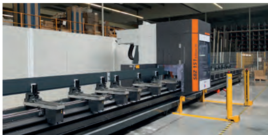
La machine de découpe 5 axes débite et usine les pièces des pergolas et les poutres de toiture des Extanxia.

tion afin de l'optimiser et de pouvoir augmenter notre capacité à fournir nos clients et notre réseau dans des délais maîtrisés. » ajoute Yoann Arrivé. 2020 marquera aussi le lancement d'une nouvelle pergola promise pour être vraiment innovante et dont la qualité ainsi que l'ensemble des options proposées permettra à l'entreprise vendéenne de se démarquer sur ce marché très concurrenté. Comme pour l'extension et la véranda, et contrairement à ce qui se pratique très souvent sur le marché, la formation initiale ainsi que l'accompagnement des professionnels de la mise en œuvre seront les clés de la réussite de ce nouveau produit, souligne le jeune dirigeant de Concept Alu.