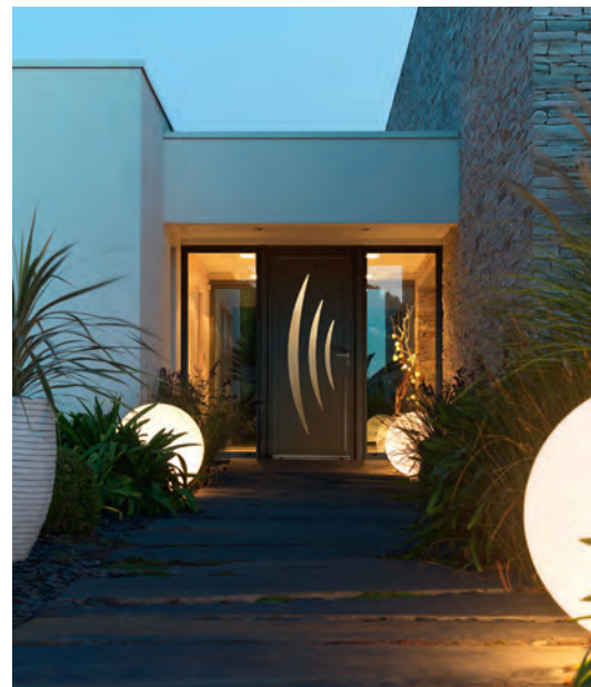
Pasquet Menuiseries propose 200 modèles de porte d'entrée, ici, le modèle AZUR en aluminium.

d'affaires consolidé de 85 M€ avec une part majoritaire dans le neuf. Associant valeurs artisanales et équipements industriels innovants, Pasquet Menuiseries développe 5 lignes de fenêtres et portes-fenêtres dans quatre matériaux. Deux lignes bois : Lignal® et Racine®, une ligne mixte bois-Alu : Auralu®, une ligne Aluminium Empreinte® et une ligne PVC : Saison®. L'offre est complétée par une gamme de portes d'entrée conçues dans ces quatre matériaux, des portes intérieures bois et des fermetures. L'attachement à la qualité se traduit entre autres par l'obtention des labels et certifications des produits fabriqués : NF, CSTB, FCBA et FSC pour le bois issu des forêts camerounaises.