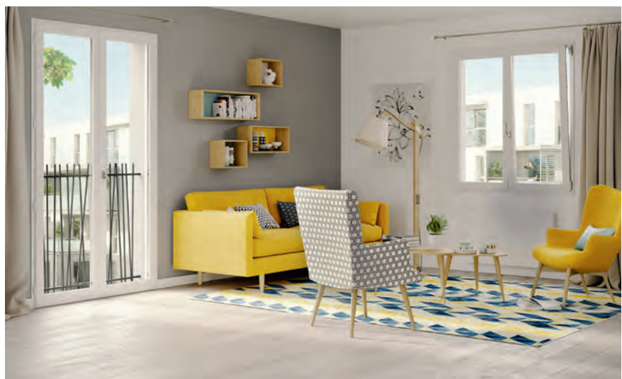
Fenêtre bois de la gamme LIGNAL.

Pasquet Menuiseries ne dévoile pas tous ses projets mais il est certain que des réflexions et des études avec ses partenaires sont en cours afin de proposer au marché une offre connectée de la fenêtre et de la porte d'entrée. L'industriel apporte aujourd'hui des solutions sur le laquage des menuiseries en bois pré-peintes ou peintes, grâce à un processus de laquage robotisé dernière génération qui permet également si besoin, un laquage en bi-coloration, tout en conservant l'aspect noble du bois. Un développement de l'activité peinture devrait voir le jour prochainement. L'objectif : l'harmonisation de l'habitat quel que soit le matériau.