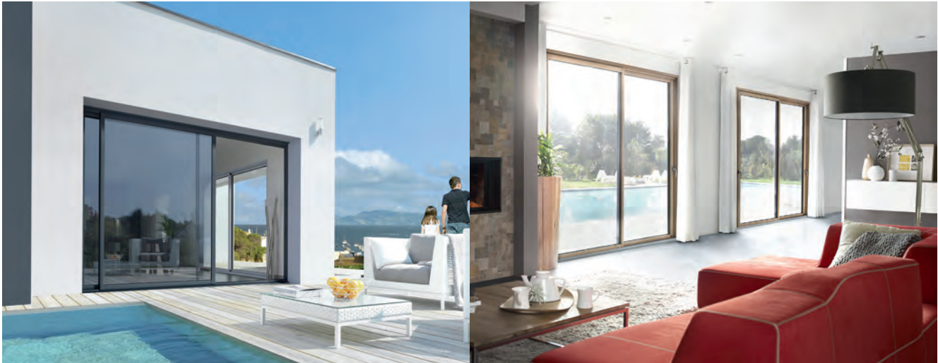
A gauche, le coulisant aluminium de la gamme Empreinte et à droite, le coulisant mixte bois/aluminium de la gamme AURALU.

d'affaires consolidé de 85 M€ avec une part majoritaire dans le neuf. Associant valeurs artisanales et équipements industriels innovants, Pasquet Menuiseries développe 5 lignes de fenêtres et portes-fenêtres dans quatre matériaux. Deux lignes bois : Lignal® et Racine®, une ligne mixte bois-Alu : Auralu®, une ligne Aluminium Empreinte® et une ligne PVC : Saison®. L'offre est complétée par une gamme de portes d'entrée conçues dans ces quatre matériaux, des portes intérieures bois et des fermetures. L'attachement à la qualité se traduit entre autres par l'obtention des labels et certifications des produits fabriqués : NF, CSTB, FCBA et FSC pour le bois issu des forêts camerounaises.