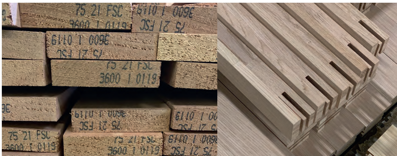
La production de bois FSC® de l'exploitation forestière Pallisco située au Cameroun qui appartient au Groupe Pasquet Menuiseries, permet à l'industriel de maîtriser ses approvisionnements.