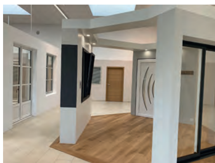
Aperçu du show-room de Pasquet Menuiseries qui vient tout juste d'ouvrir à Vitré (35). Il permet d'exposer les produits posés et d'assurer l'accueil des professionnels et des particuliers afin d'étudier leurs projets.

Ses gammes se composent de fenêtres et portes-fenêtres, portes d'entrée, portes intérieures, volets roulants et battants et se déclinent en multiples solutions pour le neuf, la rénovation et les maisons à ossature bois. A noter que Pasquet Menuiseries réalise un chiffre