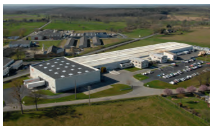
Unité de production des menuiseries PVC (La Sim) de Pasquet Menuiseries située à Val d'Izé (35).

Créée en 1925, l'entreprise est issue d'un fond artisanal de menuiserie repris par le grand-père des dirigeants actuels, Victor Pasquet. Une vie artisanale sous le signe du bois et du travail bien fait jusqu'au milieu des années 50. En 1955, la France est à reconstruire... Sous l'impulsion de Victor Pasquet le fils du fondateur du même nom, les mar-