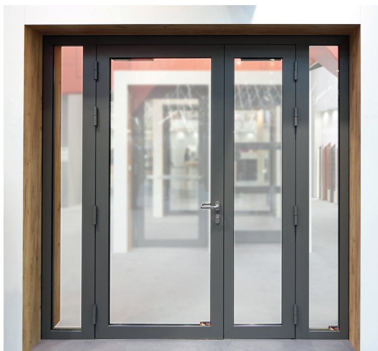
La porte WICSTYLE 65FP E 30 de Wicona

« Le marché s'oriente vers des produits tout-en-un respectant les contraintes réglementaires tout en apportant une touche esthétique avec une clarté maximale. Pour Wicona et ses clients, il s'agit de proposer une gamme complète de cloisons, fenêtres et portes vitrées en aluminium, avec un module unique de profondeur 65 mm, résistant aux flammes et fumées pendant au moins 30 mn et apportant une isolation thermique renforcée. La porte WICSTYLE 65FP E 30 s'inscrit dans une gamme 65 que nos clients connaissent parfaitement et dans un processus de fabrication inchangé, qu'ils maîtrisent au quotidien. »