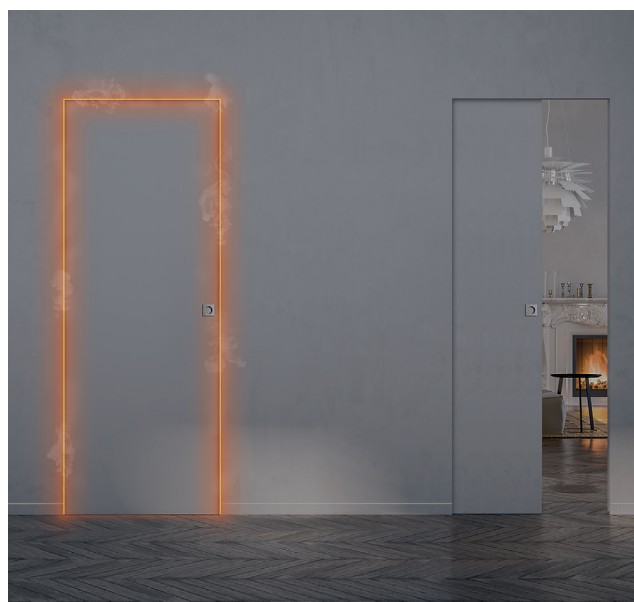
Syntesis Line EI 30, porte coulissante coupe-feu sans habillage ni couvre-joints.

Sélectionné en tant qu'innovation 2018 par le salon Artibat, le pack Syntesis® Line EI 30 se compose d'un châssis prémonté (ni habillage ni couvre-joints), d'un panneau de porte coupe-feu, de joints intumescents et d'un pion anti-dégondage à fusible thermique. En option : une fermeture automatique, une poignée fixe et une serrure avec gâche et membrane intumescentes, le tout EI 30, ainsi qu'un amortisseur de fermeture BIAS. La solution permet un passage de L. 600 à 1 000 x H. de 2 000 à 2 700 mm (2 040 en standard) pour un encombrement de 1 397 à 2 197 x H. 2 114 mm (standard), une porte de L. 630 à 1 030 x H. 2 040 mm et une épaisseur de cloison de 125 mm (plaques de plâtre).