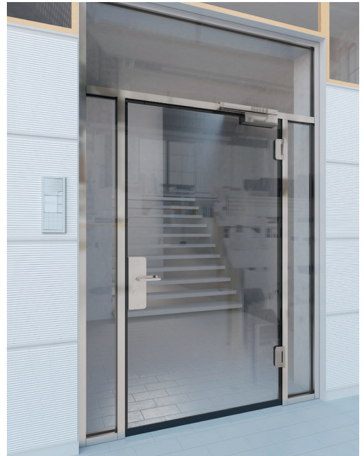
Portes d'extérieur vitrées sans cadre Promat-Glanzglastür 30. © Promat.