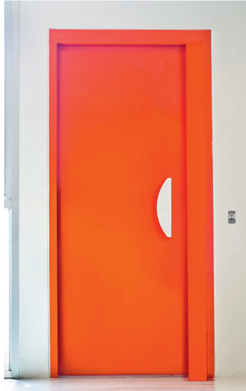
Technica Ventouse EI 30. © Picard Serrures.

Pour les accès aux locaux techniques et sous-sols avec hautes exigences sécuritaires, Picard Serrures propose depuis fin 2017 la porte acier Technica Ventouse EI 30. Alliant résistance au feu et protection anti-vandale optimale, elle bénéficie d'un verrouillage couplé à un contrôle d'accès Vigik et assuré par deux ventouses électromagnétiques de 300 kg en standard, qui condamnent la porte en cas d'incendie – ventouses de 500 kg et barre de décondamnation en option. Ouverture vers l'extérieur ; dormant acier soudé 4 paumelles ; ouvrant double-face acier 20/10e avec âme isolante en laine de roche, renforts horizontaux et battue de protection du cylindre. Disponible en 3 coloris standards (gris, blanc, marron) et toutes teintes RAL (option) avec poignée d'ouverture de type aileron assortie à la teinte.