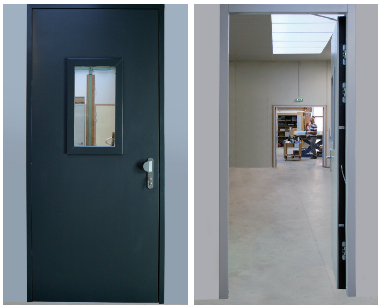
Le bloc-porte métallique EI2 60 recto/verso M 260 LI.