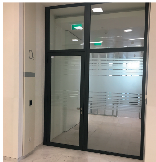
Au Jardin du Luxembourg, châssis coupe-feu et portes un vantail EI30 VD-INDUSTRY pour Protection Feu Pro.