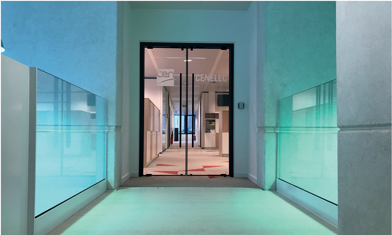
Performance et épure avec Lunax by Vetrotech, le système de porte vitrée coupe-feu sans encadrement.