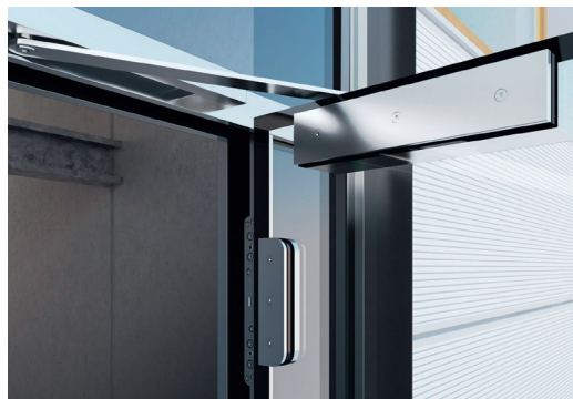
Esthétique minimaliste jusque dans les accessoires.

Tous les tests, validés, sont dans la dernière ligne droite de finalisation pour la mise sur le marché. « La robustesse de l'acier et la résistance au feu des vitrages offrent aux portes Promat®-Ganzglastür 30 une protection et une sécurité sans comparaison, promet en attendant le fabricant. Garantissant une très haute résistance mécanique, elles sont capables de supporter les nombreux cycles d'ouverture et de fermeture auxquels elles sont soumises, autorisant une mise en œuvre dans les ERP, IGH, les immeubles collectifs, etc. »