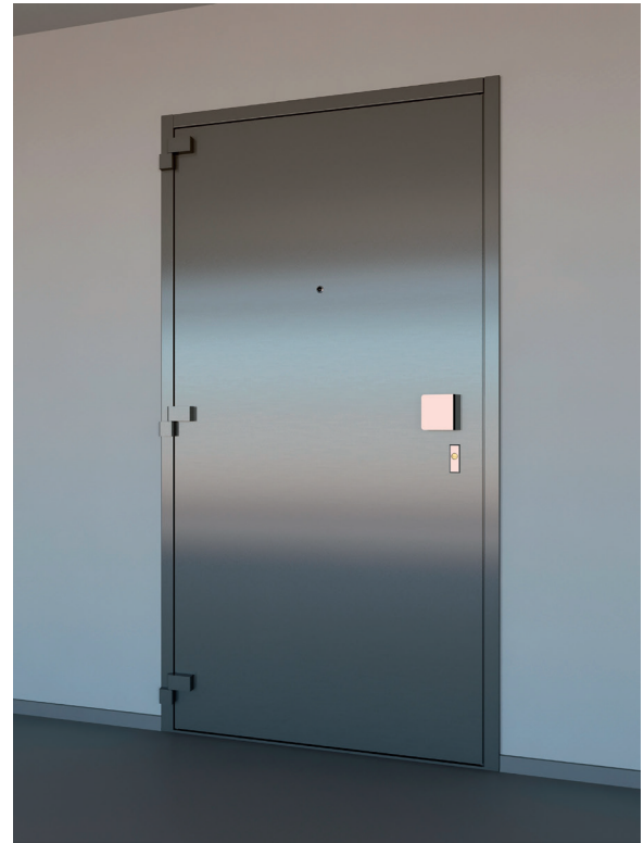
CityDoor : multi-résistante au feu, à l'effraction et aux balles.

Le bloc-porte est composé de tôles d'acier renforcé et conçu pour une installation simplifiée, sur châssis polyvalent à visser ou sceller, s'intégrant ainsi à tous types de bâtis, en neuf comme en rénovation. Proposé avec une large palette d'options, il peut en outre être raccordé à n'importe quel système de contrôle d'accès du marché. Grâce à son électronique, il est interfacé via un Bus RS485 directement sur tous les équipements Gunnebo (système de détection d'intrusion SecurWave, système d'asservissement de portes EasySas et détecteur d'unicité de passage SoloTek).