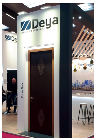
Nouvelle porte coupe-feu EI30 Deya grande hauteur. © Deya.

Acteur majeur de la porte bois coupe-feu (ex marque Blocfer), Deya a dévoilé sur Artibat la porte grande hauteur en EI 60, qui manquait encore à son catalogue. Le fabricant propose désormais une gamme complète résistante au feu jusqu'à H. 3 000 mm. Outre la nouvelle porte en EI 60 : en EI 30 pour une porte simple action un vantail ép. 40 mm (jusqu'à H. 2 990 mm et L. 1 230 mm en épaisseur de vantail 50 mm), disponible sur huisserie bois et métallique, sans joint intumescent sur l' huisserie ; en EI 90 pour une porte double vantail ép. 67 mm (jusqu'à 2 590 mm en simple vantail) sur huisserie bois pour support rigide.