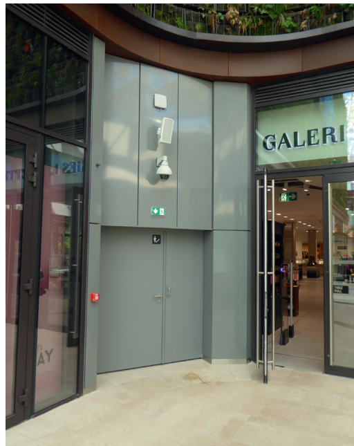
Design soigné pour les portes anti-effraction et coupe-feu du centre commercial du Prado.

(EI 60) et anti-effraction de niveau CR4 avec serrure motorisée. Bénéficiant de l'expertise de la filiale Doortal Systèmes dédiée aux très hautes performances en matière de sécurité, les portes NEXUS permettent d'atteindre des classements anti-effraction CR5 et coupe-feu 1 heure.