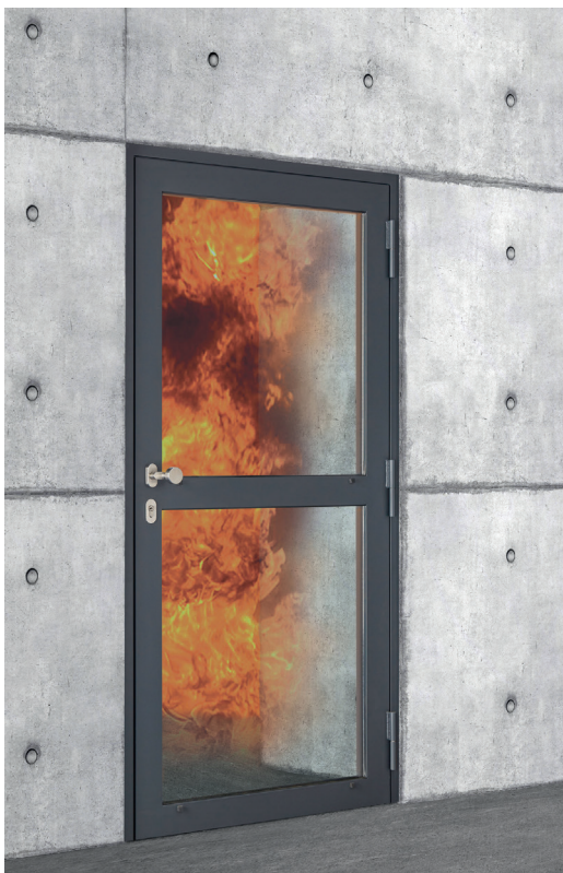
Nouvelle porte de hall en acier vitrée Rhéa EI 30 et EI 60.

Picard Serrures lance Rhéa EI, une nouvelle porte de hall EI 30 et EI 60 sur mesure en versions vitrée ou panneau plein pour le neuf et la rénovation, sur paumelles en profil acier de type Fuego Light de Forster (dimensions max. selon les PV Efectis), et en mécano soudé ou monobloc (dimensions max. de 2 500 x 2 500 mm hors tout). Selon qu'elle donne ou non sur l'extérieur et sa résistance au feu, le vitrage est un Pyrostop simple ou double 30 ou 60. Rhéa EI est équipée en standard d'un système de ferme-porte Dorma TS 93 en applique, compact, léger et conforme PMR. Disponible avec possibilité de fonction anti-panique, condamnation électrique, traitement bord de mer C5M (anti-corrosion en standard) et structures complémentaires semi-fixe, fixe, imposte et calage (profils Fuego Light 65), elle est livrée avec les accessoires pré-montés et pré-cablés.