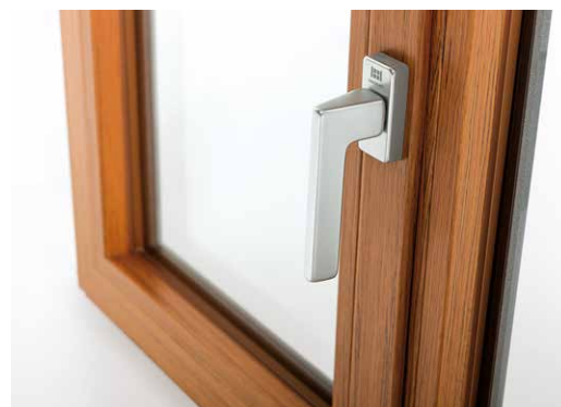
Natura, le nouveau plaxage bois d'Oknoplast.

« La qualité des plaxages est telle que le particulier ne fait plus la différence même avec du bois ou du métal, alors même que les garanties de tenue sont au rendez-vous. Natura vient compléter une offre pour l'instant d'une vingtaine de coloris plaxés, en mono et en bicoloration. Mais nous n'allons pas nous arrêter là : la couleur constitue un de nos fers de lance en 2018. Nous avons renforcé en 2017 nos lignes de plaxage sur notre site de Cracovie, ce qui va nous permettre en outre d'être encore plus compétitifs grâce à la mutualisation des coloris sur nos marchés européens, et nous accompagnons ces développements par la formation de nos distributeurs, pour les aider à mieux connaître et vendre ces produits. »