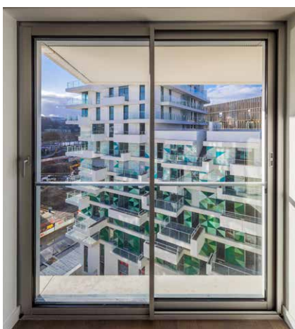
Unik. Les baies mettent en scène la générosité des vues.

J'essaie de traiter l'apport de lumière et le jeu avec l'obscurité nécessairement