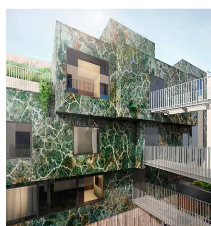
Béton marbré et ouvertures XXL (Schüco) pour l'hôtel 5* Parister récemment livré à Paris. © Beckmann-N'Thépé.