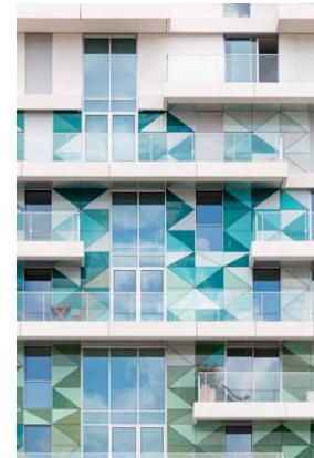
Géométries combinées des ouvertures et des vitrages colorés en parement.