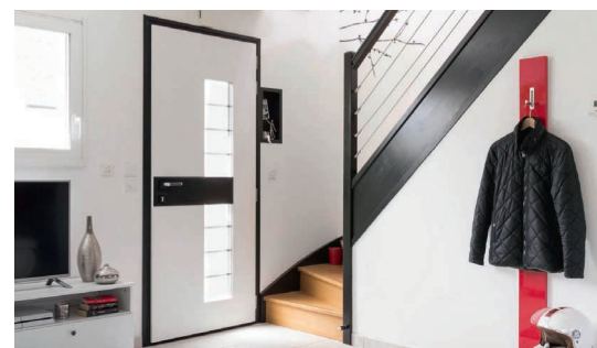
La porte Samourai avec un insert de cuir et de pierre.

qu'auparavant avec un stand de 350 m 2 conçu autour d'un thème aussi original qu'atypique ! Pour nous Batimat a toujours été le salon qui rythme notre innovation. Cette édition sera marquée par le lancement de notre nouvelle gamme de portes d'entrée. Nous avons totalement repositionné notre offre en centralisant les savoir-faire de FPEE mais aussi des autres entités du groupe comme Mixal par exemple. Cela a été un projet transversal entre les différentes marques du groupe mais aussi un travail tentaculaire ! Nous avons retravaillé tout le marketing produits, redessiné et repositionné les gammes pour rendre l'offre beaucoup plus cohérente. Parallèlement à ce projet, nous avons conçu une porte monobloc 100% FPEE dont la conception est totalement exclusive. Nous continuons notre partenariat industriel avec le groupe