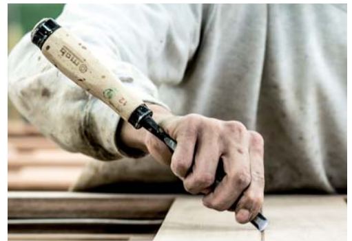
Les opérations manuelles sont nombreuses, en parallèle à l'automatisation.