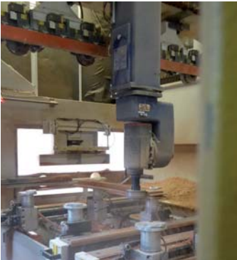
Cintrage : une machine rogne le bois pour former le rayon choisi.