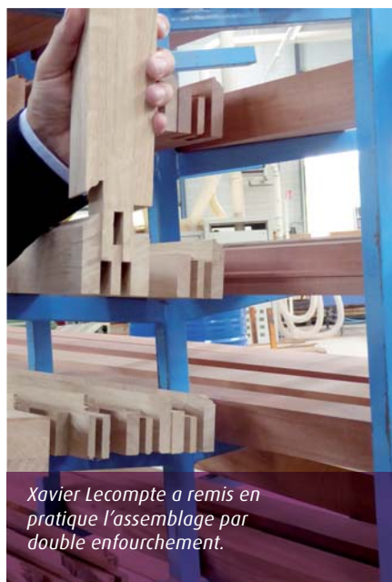
Xavier Lecompte a remis en pratique l'assemblage par double enfourchement.

durables et contemporaines : couleurs opaques tous RAL, lasures tons bois, à garantie certifiée 10 ans. Certaines menuiseries posées il y a 18 ans (à Guéret ou Neuilly) sont « comme neuves » : la durée de vie réelle serait donc plutôt de 25 ans ! Les produits lasurés ne représentent plus que 20 % de l'activité et la bicoloration fait partie des options. Un robot de peinture intervient après application d'une couche de produit isolant. Le nouveau process de finition a réduit de 12 à 4 h le temps de séchage. L'ancienne cabine est utilisée pour les couleurs spécifiques, en particulier sur les portes. Sont déclinées des finitions métallisées ou huilées (celle-ci travaillées pour un jour être adaptées aussi en extérieur). « L'intérêt de la couleur est de permettre à la fenêtre de s'intégrer à des univers traditionnels ou contemporains. La fenêtre s'inscrit dans la décoration, comme le meuble »... De la menuiserie à l'ébénisterie ! « Mon Métier est de donner envie et de réaliser le rêve de nos clients », répète le P-dg. Les produits proposés permettent d'accéder à une offre de qualité déclinée en divers styles et niveaux de gamme : « Tradilou, la qualité à l'ancienne, Estilou, la modernité à l'ancienne, Estibelle, la belle qualité, et Primabelle, le 1 er prix de la qualité ». Les portes d'entrée -50 au catalogue- réalisées aussi sur-mesure, sont personnalisées ou entièrement imaginées par le client final. Rendez-vous sur Artibat et EquipBaie ! ■■