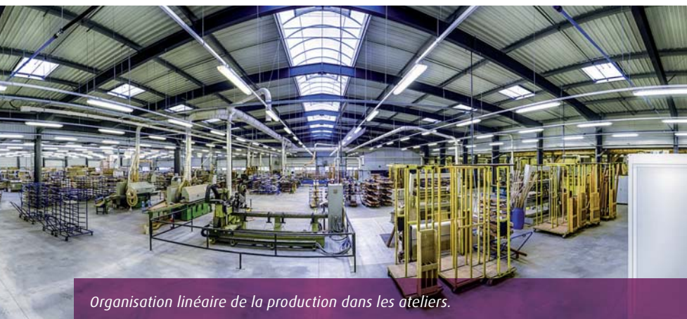
Organisation linéaire de la production dans les ateliers.