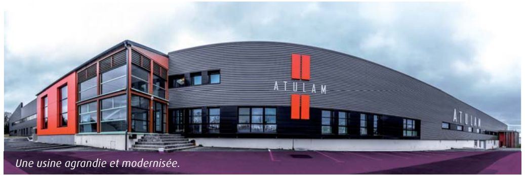
Une usine agrandie et modernisée.