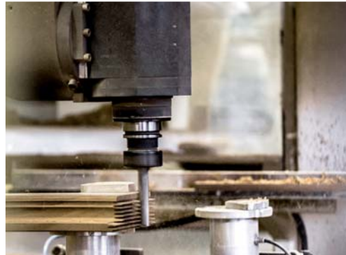
Atulam est équipé de plusieurs centres d'usinage dont un à 5 axes.