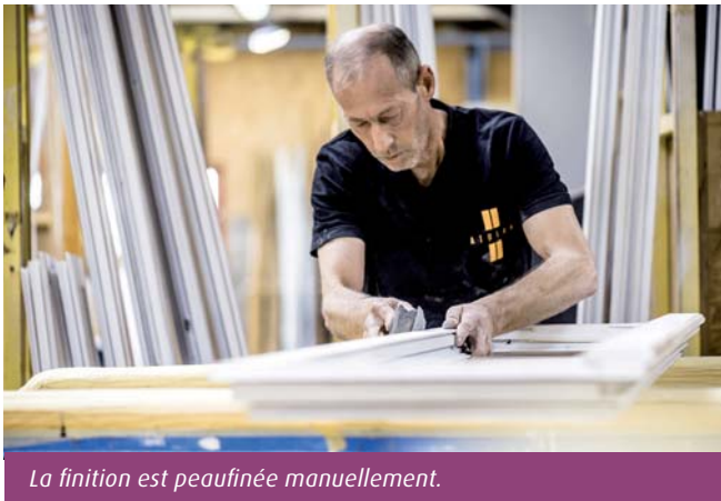
La finition est peaufinée manuellement.