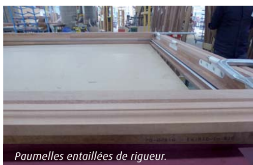
Paumelles entaillées de rigueur.