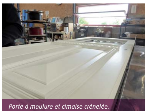
Porte à moulure et cimaise crénelée.