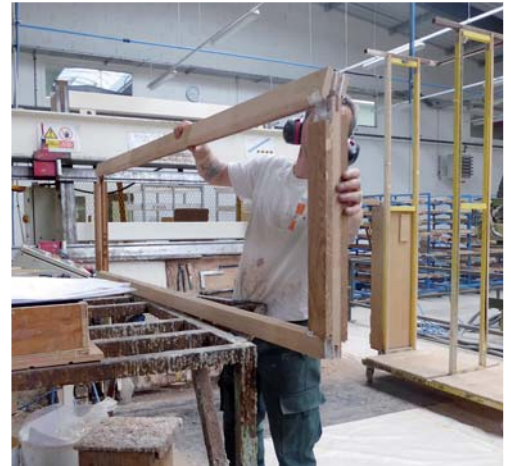
Assemblage par collage manuel des cadres, avant passage à la presse.