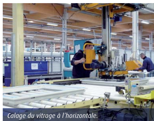
Calage du vitrage à l'horizontale.