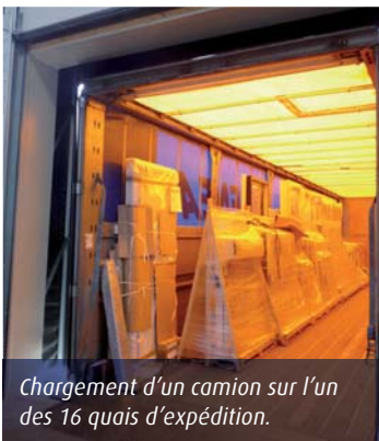
Chargement d'un camion sur l'un des 16 quais d'expédition.