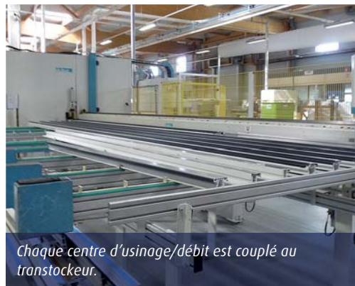
Chaque centre d'usinage/débit est couplé au transtockeur.