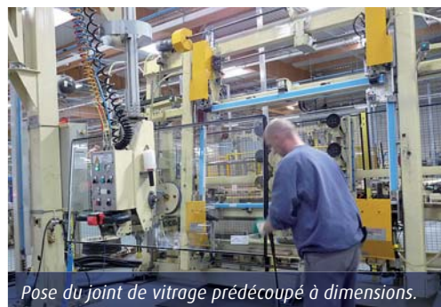
Pose du joint de vitrage prédécoupé à dimensions.