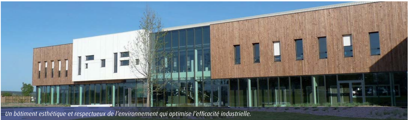
Un bâtiment esthétique et respectueux de l'environnement qui optimise l'efficacité industrielle.

dans 15 ans, et cite 6 M€ d'investissements dédiés à l'ergonomie des postes de travail. Les équipes polyvalentes travaillent désormais en 2x8, au lieu de 3x8. L'esthétique du bâtiment est à la hauteur de son efficacité, avec ses habillages de béton blanc et bardage bois, son environnement paysagé (22 765 végétaux plantés) et ses patios intérieurs. L'usine doit assurer 30 % de croissance en optimisant la polyvalence (équilibrage des capacités et charges entre les gammes) et les flux de production, de l'extrusion aux 16 quais d'expédition. La pièce maîtresse, un impressionnant transtockeur Kasto, assure la gestion automatisée des approvisionnements : 134 m de long x 24 m de large x 20 m de haut, superficie de 3150 m 2 , poids 7000 T à vide et 11 750 T plein, 3958 cellules pour 24 postes de rangement et 40 mouvements/h. Il sera alimenté directement par l'atelier d'extrusion, dès son transfert de l'ancien site (été 2015). Les 24