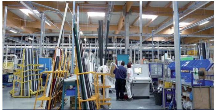
Les ateliers (ici, zone alu) sont baignés de lumière naturelle.