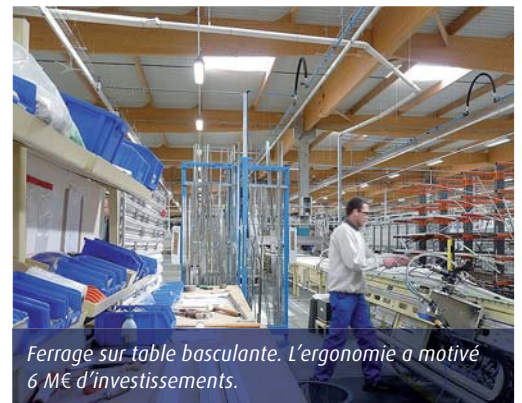
Ferrage sur table basculante. L'ergonomie a motivé 6 M€ d'investissements.